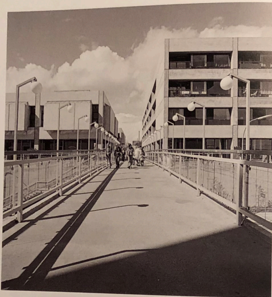
Gellerup, 1972.