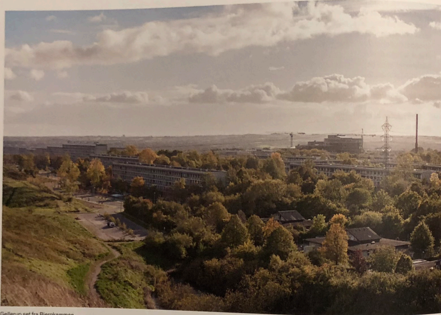
Gellerup set fra Bjergkammen.