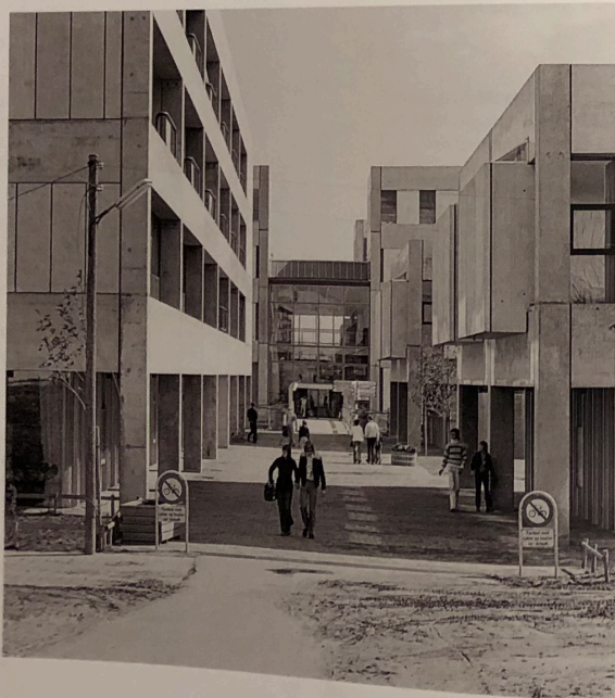
Gellerup, 1972.

at gøre det samme i Aarhus bymidte. Vi er så ufri i forhold til tidsånden, også os arkitekter.