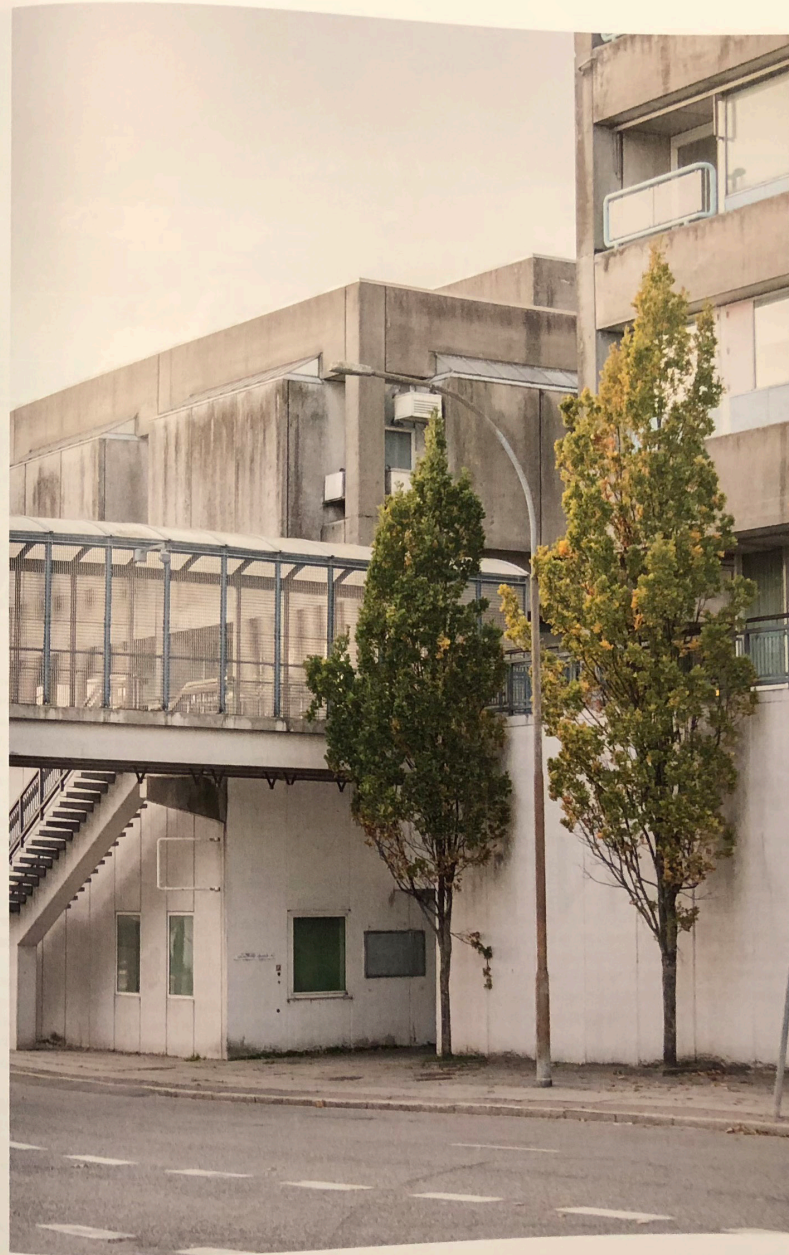
Ankomstbroen til Gøllersupplønnen over Gudrunavej.