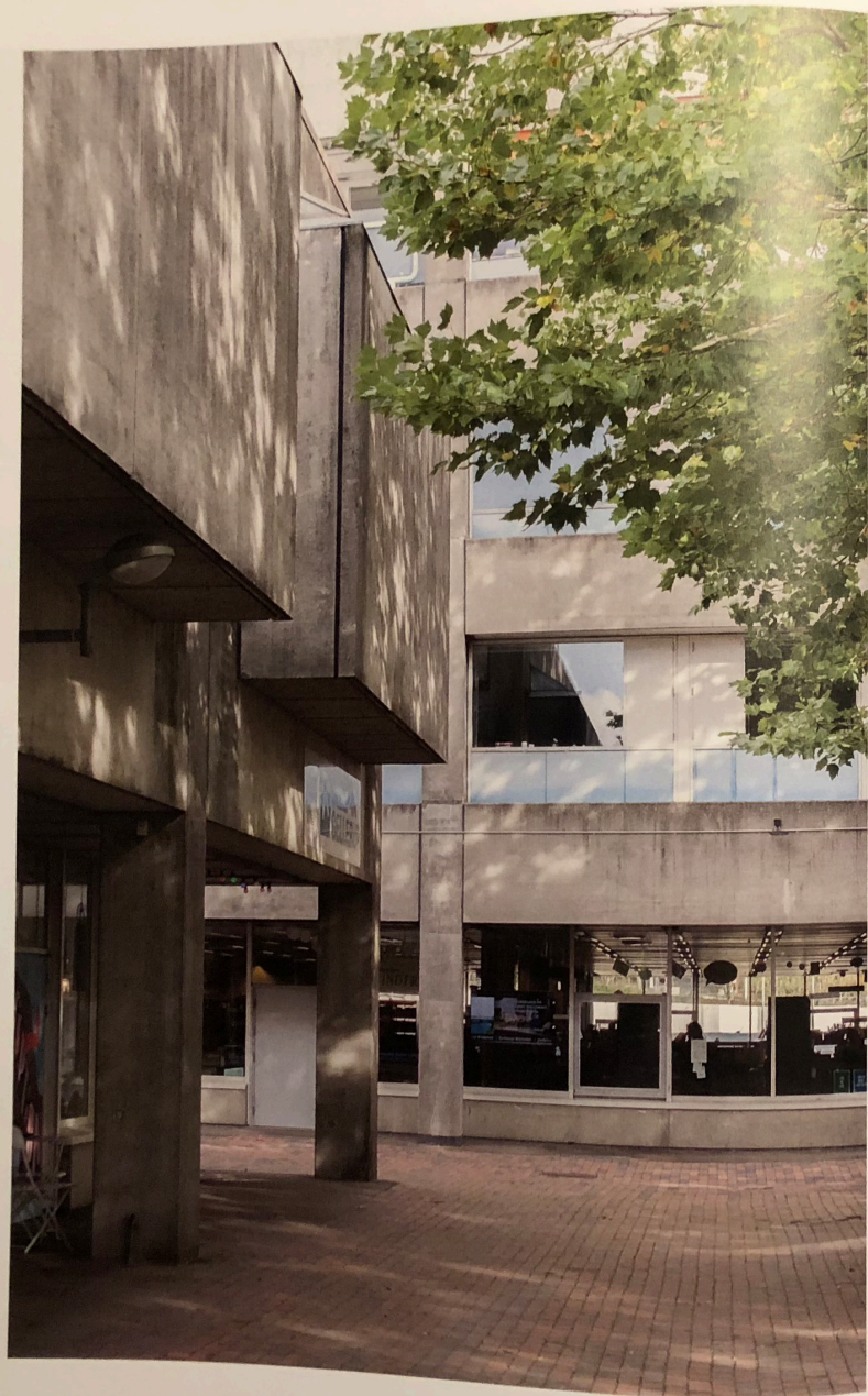
Kollektivhuset, med bibliotek, i stueetagen, og ungdomshuset tv.