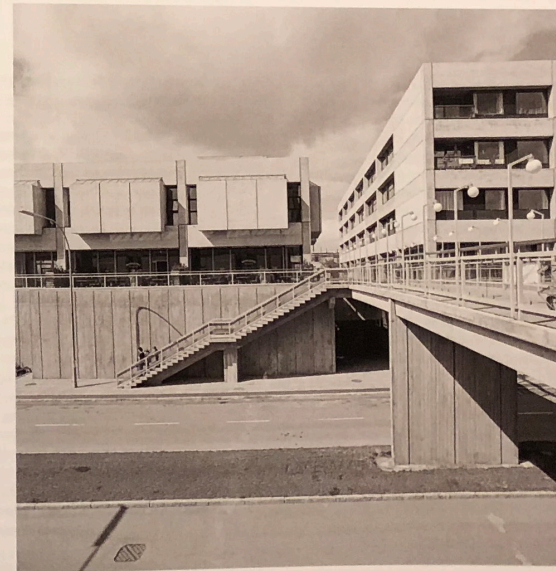
Gellerup, 1972.