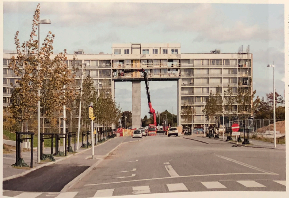
Prøveboksen 'Guldhuset' renoveres af Tegnestuen Vandkunsten. Gennemskæringen leder en ny vej ind i planen.