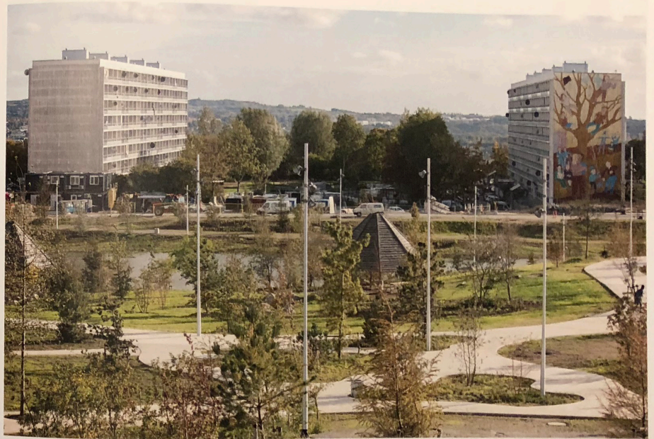
Gellerup Bypark fra 2018, tegnet af SLA og EFFEKT.