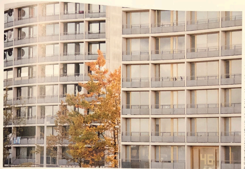
Th. 'Guldhuset' med nye, guldfarvede vinduer. Tv. blik med de oprindelige vinduer med sorte terrammer.