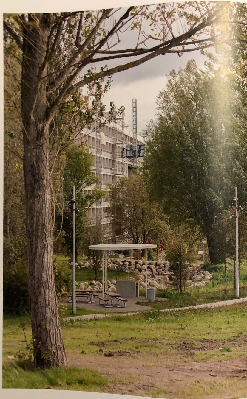
Nyt parkrum i midten af Gellerup, tegnet af SLA og EFFEKT.